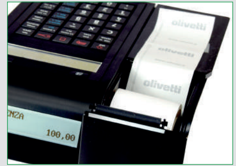
Inserimento rapido e agevole del rotolo carta