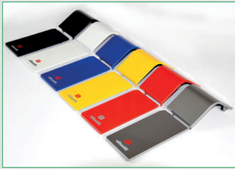
Design moderno e look personalizzabile