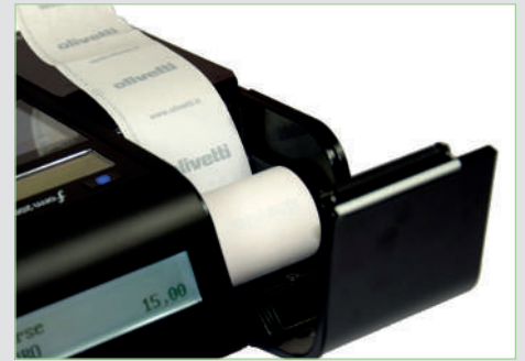
Inserimento rapido e agevole del rotolo carta