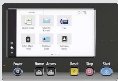
Nuovo pannello da 7"