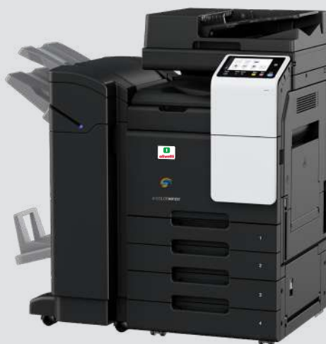
Con FS-539SD e PC-218