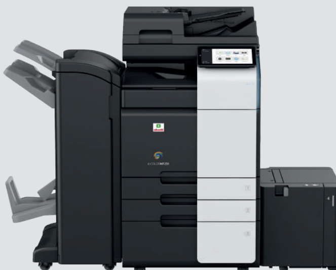
d-Color MF309 con DF-714+PC-416+LU-302+RU-513+FS-536SD