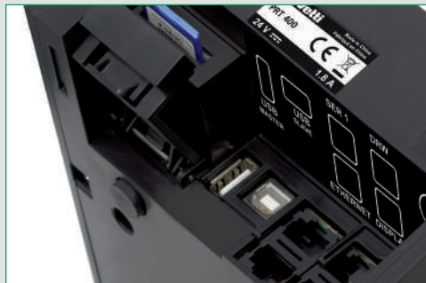
Giornale di fondo elettronico