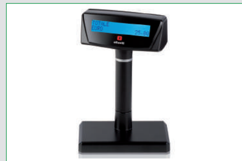
Display alfanumerico mono e bifaccia