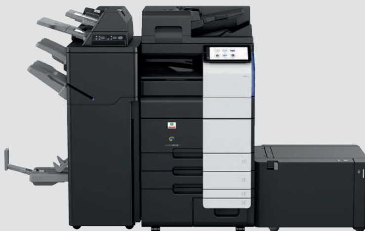
Configurazione con Finisher FS-540SD, con post-inserter PI-507 e unità di connessione RU-519, cassetto laterale LU-205